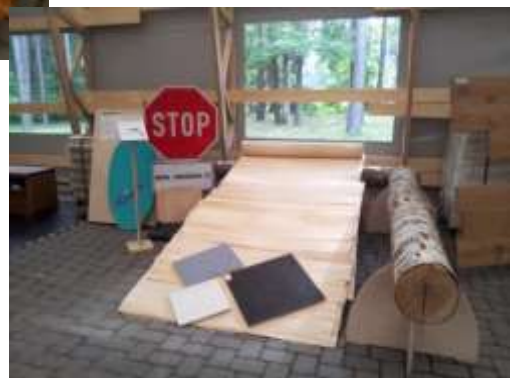
Latvijas Finiera ekspozīcija.